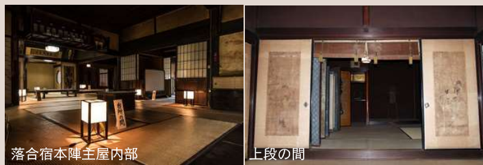
落合宿本陣主屋内