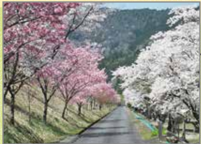
さくら (見頃: 4月上旬~)