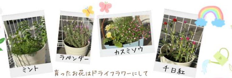
育ったお花はドライフラワーにして くりっこを彩ってくれています♪