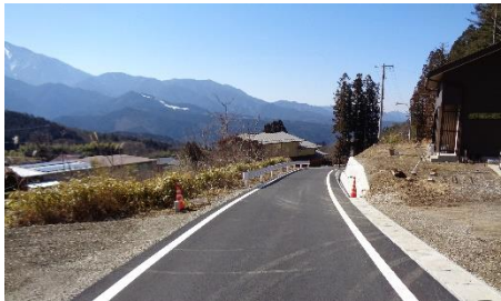
県営中山間 塩野集落