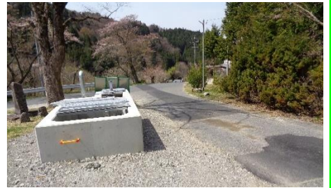
県営中山間 川並用水