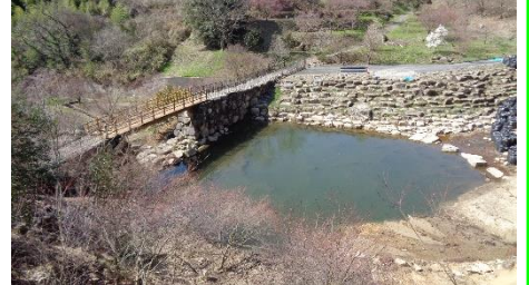
島田砂防ダム土砂排土