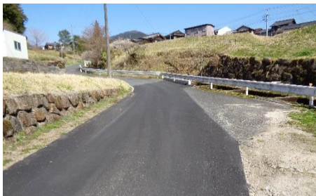
寺川西口路面災害復旧