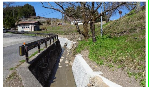
寺川護岸災害復旧