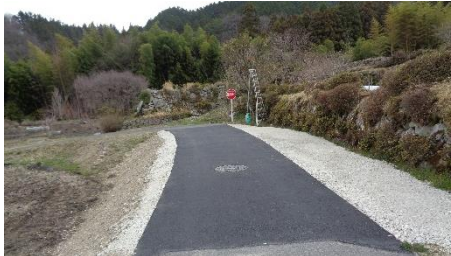
県営中山間 細野防火