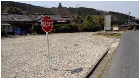
県営中山間 新道防火