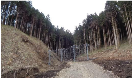
寺川上流強靱ワイヤーネット