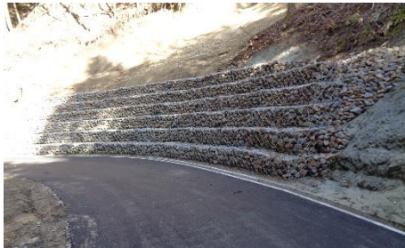
下小路法面災害復旧