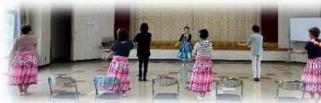
↑楽しいフラダンス