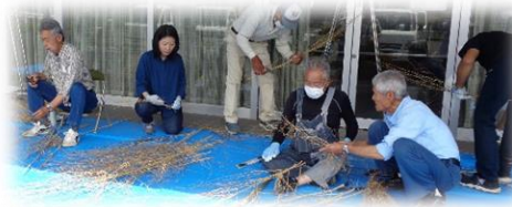
↑おじいちゃんの知恵袋講座