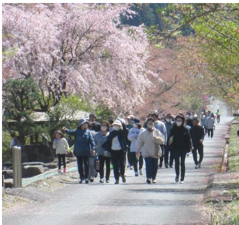
ウォーキング教室

4月9日、「第23回湯舟沢リバーサイドマラソン大会・ウォーキング教室」が体育協会神坂支部主催で4年ぶりに140人もの参加をいただき盛大に開催されました。 当日は、春の風によって好タイムとさわやかな汗を流しながらがんばる出場者への歓声が湯舟沢河川公園一帯に響き渡りました。