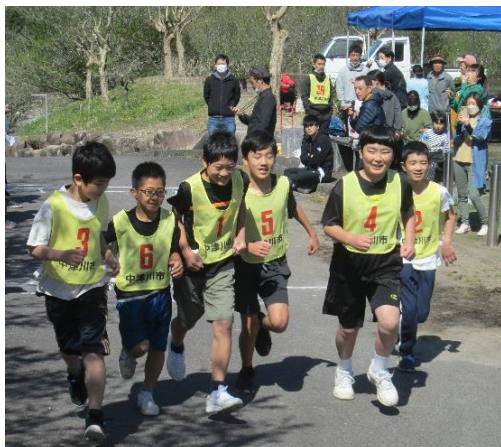
マラソン大会中学生男子の部