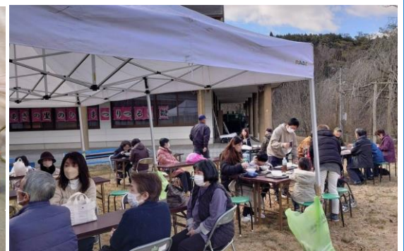
一日 100 食限定の手打ちそば完売！

2月28日(水)より3月3日(日)まで「あぎの里ひなまつり・つるしかざり」が中の島公園で開催されました。ウェルカムスペースで迎えてくれたのは阿木小学校「つるしびなクラブ」10人の作品で、本格的なつるし雛が並びました。SNS対応の映えるスポットではチューリップが設定され来客は楽しんでいました。開催日は多くの方で賑わい3,981人の来場者がありました。ひなまつりが始まり25年目・つるしかざりは15年目の今年も、関係者の皆様が一丸となり盛大に開催されました。