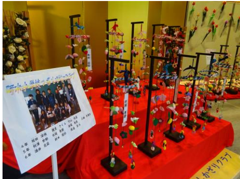
小学校「つるしびなクラブ」の作品