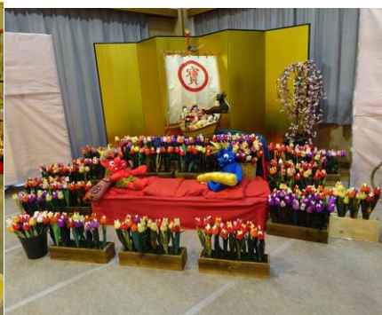
新作のチューリップ