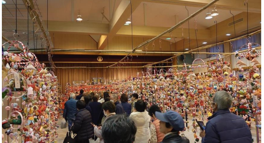
大勢の方で賑わいました