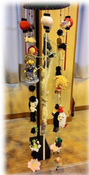
「千と千尋の神隠し」の世界