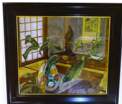
自粛生活・柴田美雪作