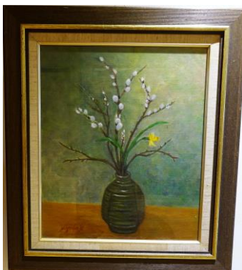
静物・加藤京子作