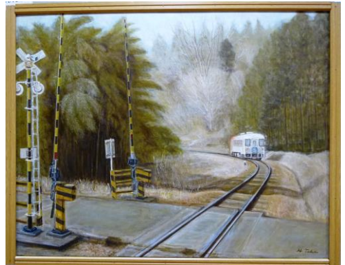
陽光・武田彦郎作