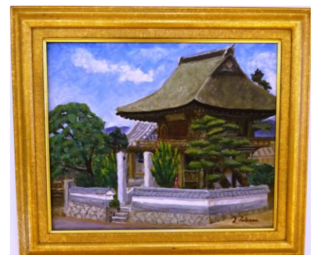
山門・鷹見靖子作