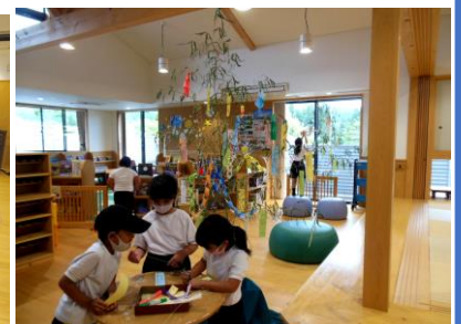
短冊を作り飾ってます