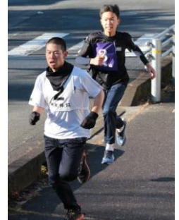
トップの激しいデットヒート