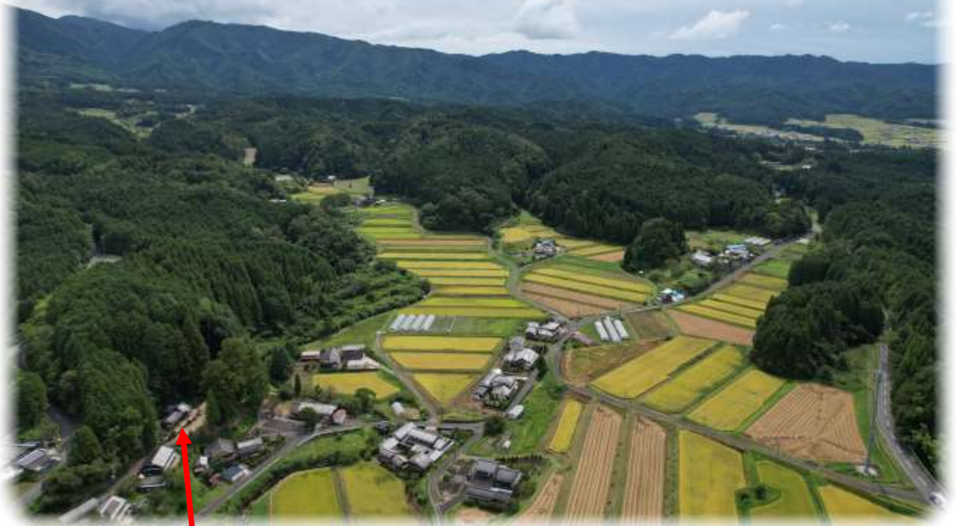
こやすかんのん しんめいじんじゃ 子安観音・神明神社