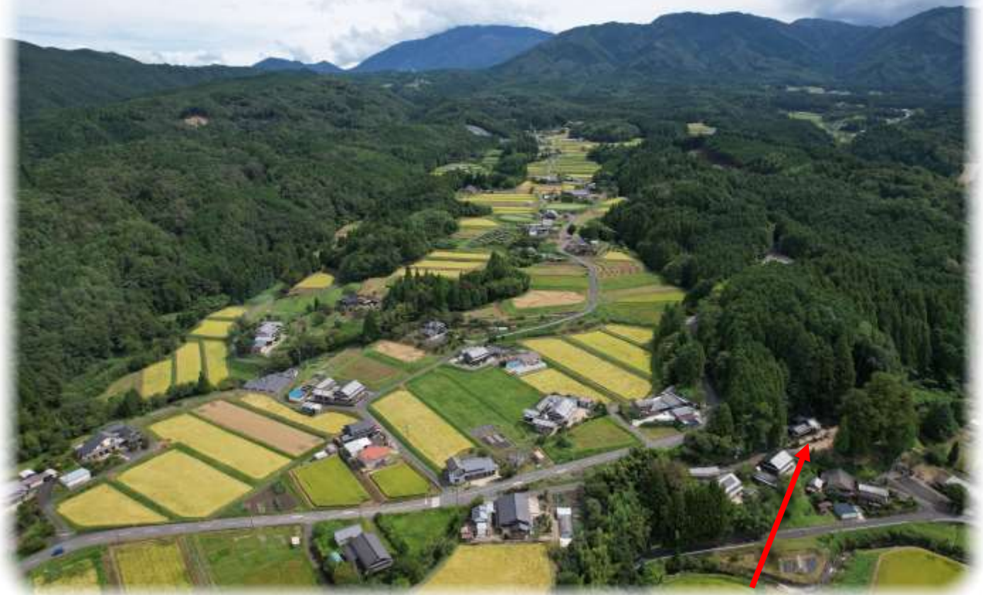
こやすかんのん しんめいじんじゃ 子安観音・神明神社