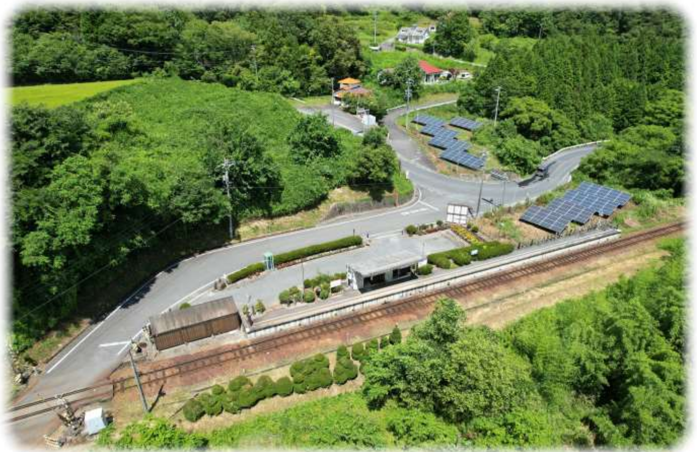
あけちてつどう いいぬまえき 明知鉄道 飯沼駅