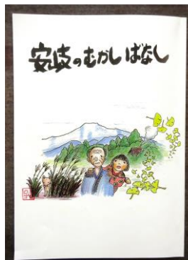
「安岐のむかしばなし」表紙

冊子は地域や学校、図書館等に配布し、公民館講座や三世代交流等の事業で活用していきます。また、来年度は郷土かるたを作成する予定です。