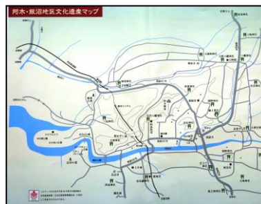
「阿木・飯沼地区文化遺産マップ」