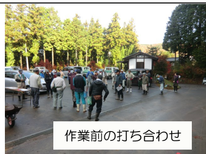
作業前の打ち合わせ

そこで、コース整備や掲示板の設置などは建設委員会、落合マレットゴルフ愛好会、そして落合、神坂、馬籠、山口地区の有志のみなさん延べ約500人のご協力を得て実施しました。また、まち協からは原材料の支給等で支援を行ってきました。まだ不十分な箇所もあり、今後も整備を行いますが多くの有志のみなさんのおかげで、4月1日のオープンを迎えられることが出来ます。寒い中、しかも手弁当で作業にご協力いただいたみなさんにはただただ、頭が下がるばかりの思いで、足を向けて眠れません。ありがとうございました。今後は管理運営で区民のみなさんにお世話になりますが、ご理解とご協力をお願い申し上げます。これからも、とても素晴らしいコースになるように整備を進めていきます。ぜひお越しください。