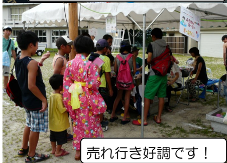
売れ行き好調です!