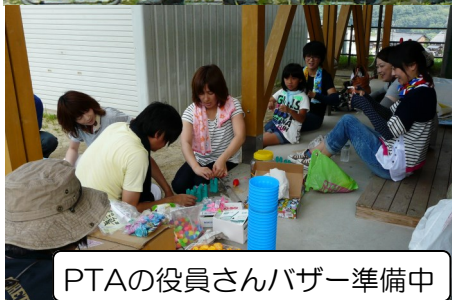
PTAの役員さんバザー準備中

落合公民館を拠点に活動しているREALの 子ども達の驚きのダンスパフォーマンス!