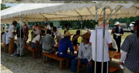
当日10時からの準備、みなさんフラフラでした!

津島神社祭典、おがらん神社祭典に続いて3週連続の落合ふるさと祭りが8月8日に開催されました。今年は諸般の事情から8月開催となりましたが、時期がよかったのか、チラシがよかったのか(私が作りました)、豪華景品に釣られたのか、やっぱり落合人はお祭り好きなのか、いろいろな要因が重なり合ったと思いますが、想定を超える数のお客様に来ていただきありがとうございました。おかげで700枚用意していたお楽しみ抽選券が締め切り前に無くなってしまいました。申し訳ありません。ちびっ子たちが、ようかい体操にあのように参加してくれるとは考えてなくて参加賞が無くなってしまいました。ごめんなさい。まことに申し訳ありません。すごい夕立が来てしまいました。これは仕方ないですね。準備や片付けは大変ですが、多くのみなさんが関わってくれて、子どもからお年寄りまで楽しめるふるさと祭りがこれからも続きますように!