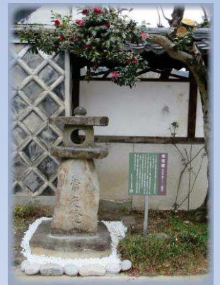
▲ 上田家横の常夜燈

このたび、落合まちづくり推進協議会中山道落合宿保存整備推進委員会が往時の宿場の風情を甦らそうと、市の景観づくり支援活動事業補助金を活用するなどして、3基の常夜燈を宿場内の、上田家横、本陣横、善昌寺前に移し、案内板と柵も設置しました。140年ぶりに宿場内に据えられた4基の常夜燈が、落合宿の新たな風景となって訪れる人を迎えてくれます。