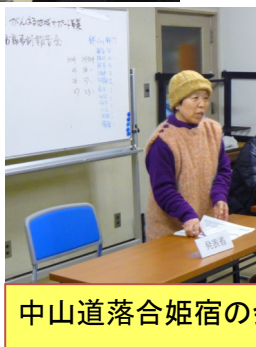
中山道落合姫宿の会