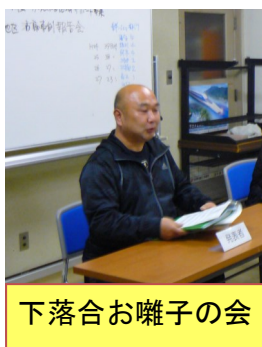
下落合お囃子の会