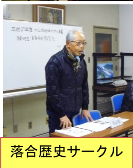
落合歴史サークル

2月25日に平成27年度がんばる地域サポート事業の補助を受けて事業を実施した落合地区の5団体（下の写真参照）の活動事例が審査会である区長会で報告されました。5団体が活動している地区は落合だけです。市内には全く事業の行われていない地区もあります。まちづくりへの強い思いを感じました。詳細は5月に回覧。