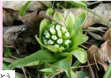
山中地区で見つけた梅・猫・ふきのとう