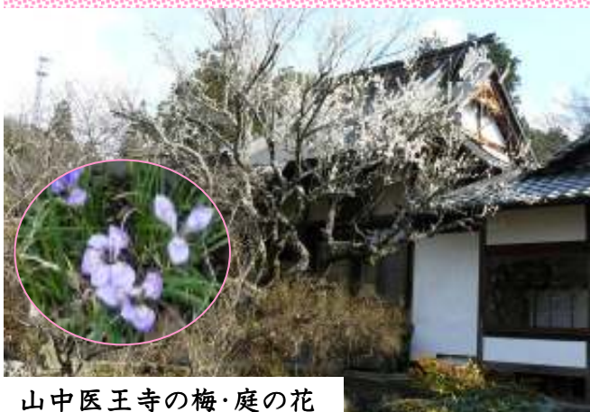
山中医王寺の梅・庭の花