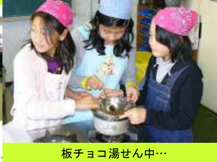
板チョコ湯せん中…