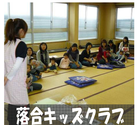
落合キッズクラブ