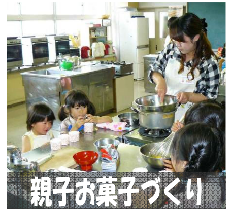
親子お菓子づくり