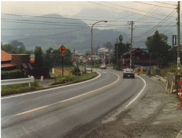
昭和59年夏ごろ撮影