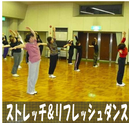
ストレッチ&リフレッシュダンス