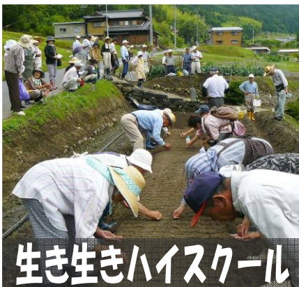
生き生きハイスクール