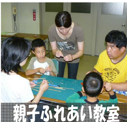
親子ふれあい教室