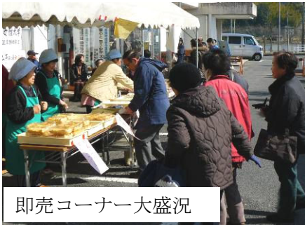
即売コーナー大盛況