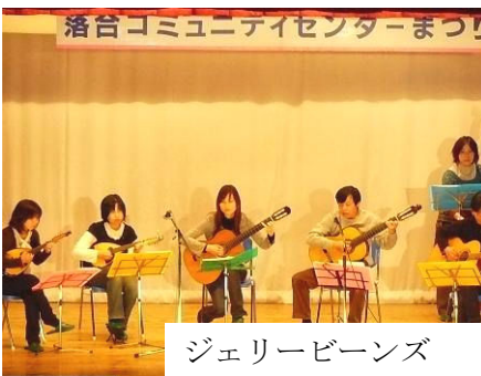
ジェリービーンズ