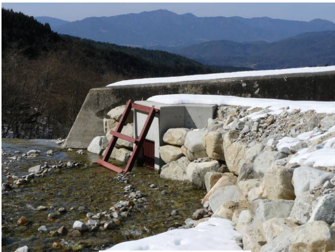
落合川本谷第六砂防ダム

この工事は岐阜県単独事業として実施されたもので、工事費の36%を地元が負担することになっており、9号区では「中山間地域等直接支払制度」を利用することになっています。