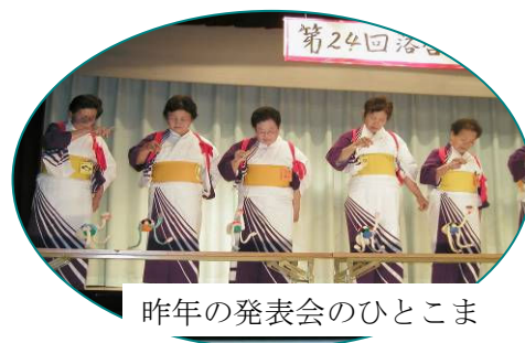
昨年の発表会のひとコマ