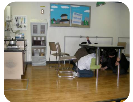
名古屋市港防災センター内を見学・体験の様子