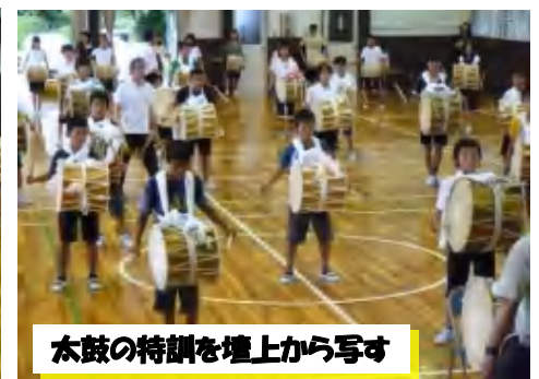
太鼓の特訓を壇上から写す

落合小学校では、6年生の前期総合学習に、地域の芸能文化の継承として「風流おどり」に取り組みました。ただ、芸能文化として踊りを習い覚えるだけでなく、地域社会と協働し、学校内外で子どもが多くの人々と接する機会を増やすことも目標としています。