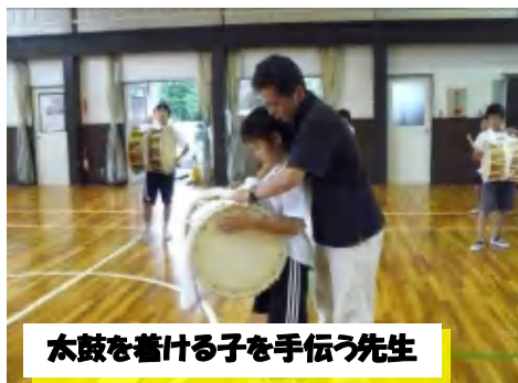
太鼓を着ける子を手伝う先生