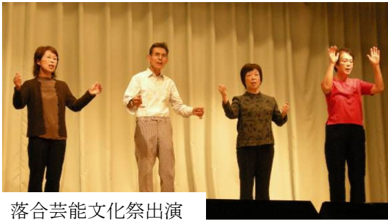
落合芸能文化祭出演