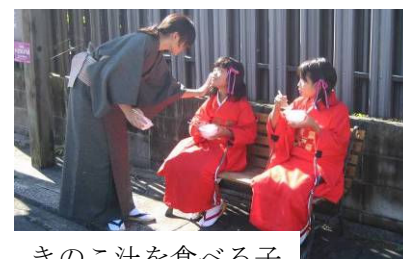
きのこ汁を食べる子