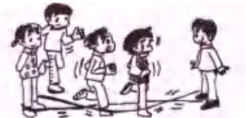
ゴム・ダンス・ステップよん

今月 10月20日(土)は 『チャレンジ・ザ・ゲーム』に挑戦 ～申し込み期限…10月10日(水)～