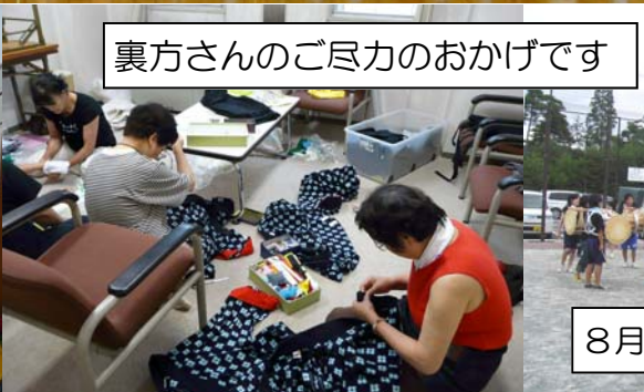
裏方さんのご尽力のおかげです