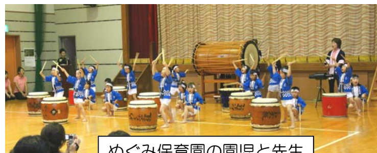
めぐみ保育園の園児と先生