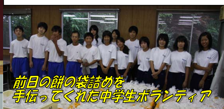
前日の餅の袋詰めを手伝ってくれた中学生ボランティア

自転車、Wii、飛騨牛他豪華賞品を獲得したラッキーなみなさん。飛騨牛はおいしかったですか？