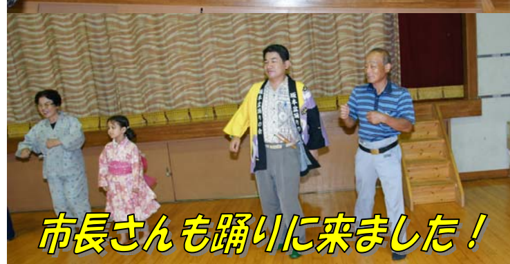
市長さんも踊りに来ました！

これが「美濃坂本音頭」の許し状です。「美濃坂本音頭」が完璧に踊れないともらえません。草津節ではだめです。炭坑節はなおさらです。坂本人なら踊れますよね？