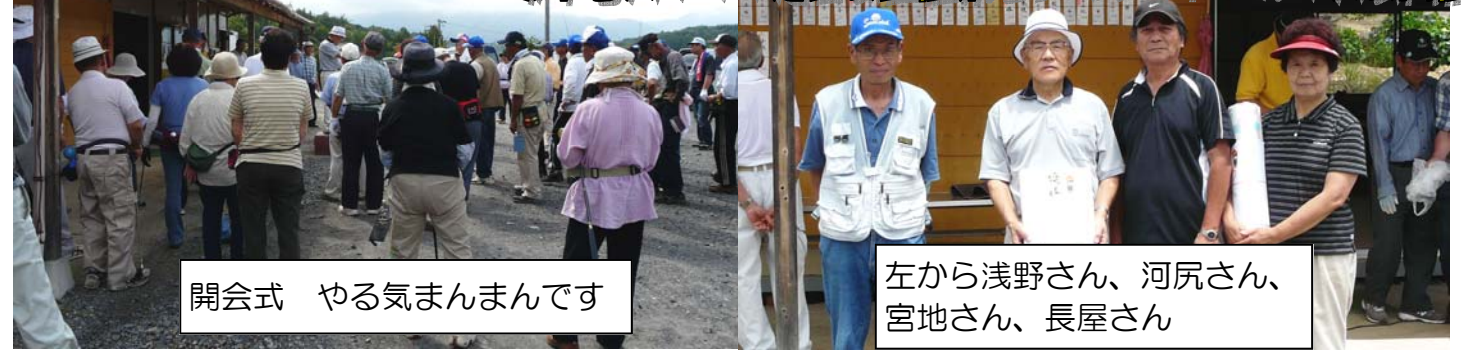
開会式 やる気まんまんです