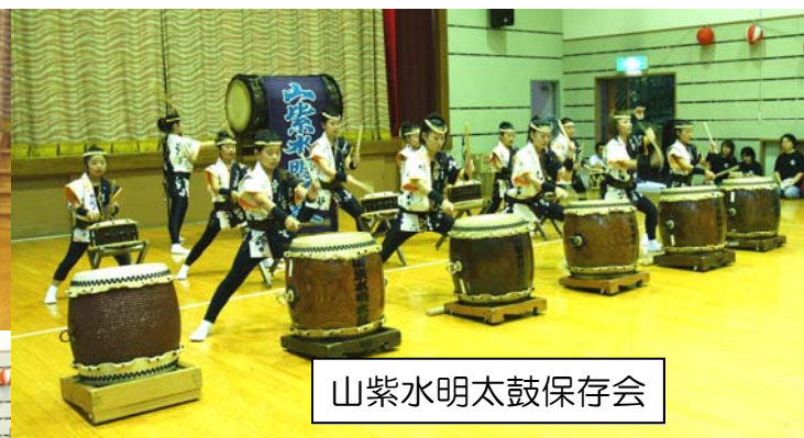
山紫水明太鼓保存会