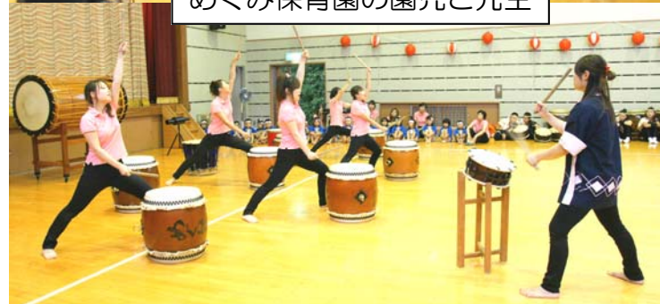
アドベンチャーズ