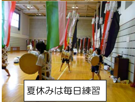
夏休みは毎日練習