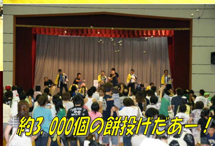
約3,000個の餅投げたあー！

これが「美濃坂本音頭」の許し状です。「美濃坂本音頭」が完璧に踊れないともらえません。草津節ではだめです。炭坑節はなおさらです。坂本人なら踊れますよね？