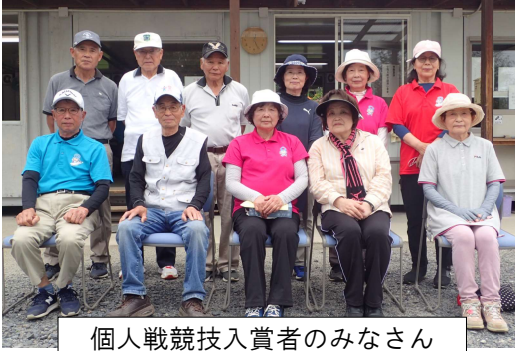
個人戦競技入賞者のみなさん