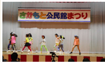
昨年のステージ部門