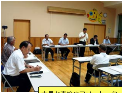
市長と直接のフリートーク

8月2日に、はなのきセンターにおいて坂本地区市政懇談会が開催され、市政報告に続き、坂本のまちづくりについて話し合われました。