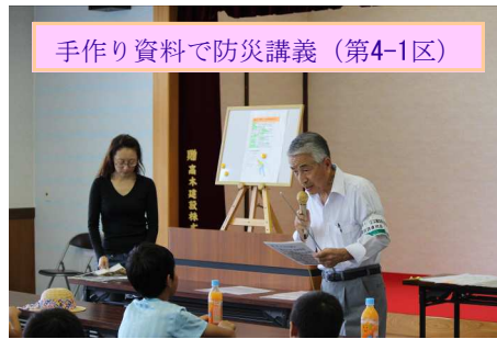
手作り資料で防災講義（第4-1区）