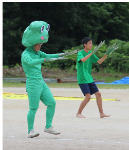
～コミカルなカエルのダンス～

9月3日（水）に中津川工業高校の体育祭が開催されました。晴天の中、中津川工業高校の大地には熱気と笑いがあふれていました。写真は生徒による応援合戦の様子です。東軍・西軍・南軍・北軍に分かれての応援合戦は迫力があり、見ごたえ抜群でした。