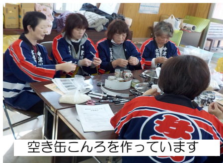
空き缶こんろを作っています