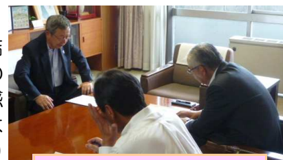
市長に報告する市岡区長会長

8月29日に坂本区長会の正副会長3名が、リニア中央新幹線アンケート調査の結果を市長に報告しました。6月に区長会が住民に実施したアンケートは904件の回答（回答率53.7%）をいただきました。その中から、日頃区民の皆さんが感じている不安や計画に対するご意見を市長に直接伝えました。今後、区長会では継続して区民の皆さんの意見を市に伝えながら、『住みよい坂本』のまちづくりへと繋げていく予定です。坂本区民一人一人の声が、より多く市へ届けられるよう、区長会への皆さんのご支援・ご協力をお願いします！