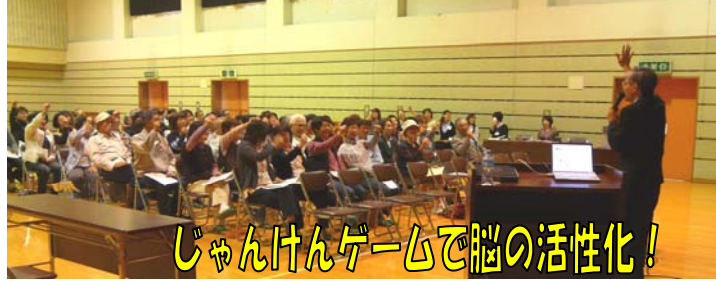
杉田先生の話にみなさん納得! じゃんけんゲームで脳の活性化!