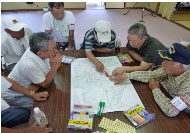
自主防災会長(区長)も図上訓練に参加(7区)

大地震は近い将来に発生するといわれています。東海地震はいつ発生してもおかしくない状況です。災害発生直後は他からの援助はまず受けられません。「自分の命は自分で守る。備えあれば憂いなし」を合言葉に、一時避難場所への経路や家族との連絡方法など、見つめ直してはいかがでしょうか。