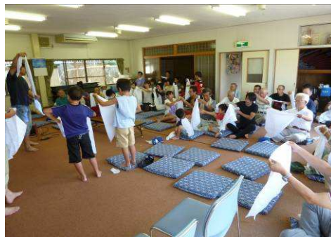
小学生も三角巾に挑戦(8区)