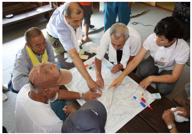
女性職員より図上訓練の指導を受ける(13区)