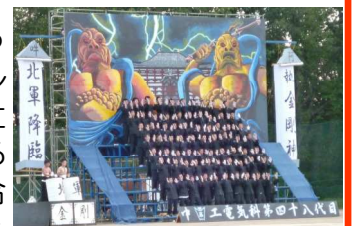
迫力ある応援合戦

9月4日に中津川工業高校第64回体育祭が開催されました。小雨の降る中で始まった体育祭も、競技の熱気と共に快晴へと変わり、強い日差しの中での熱戦となりました。工業高校は坂本地区で唯一の高校です。ものづくりの楽しさや大切さを学び、社会に貢献する人材を育成しています。「誠実な行動をとり、信頼される人間となるように」の校訓は生徒に限らず誰もが実践したいものです。写真は生徒による応援合戦の様子です。北軍・東軍・西軍・南軍に分かれた応援合戦は迫力があって見ごたえ十分です。来年は是非、皆様もご覧になってはいかがでしょうか。