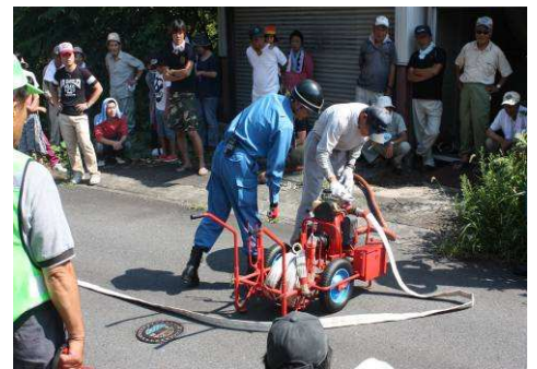
消防団も大活躍(11-2区)