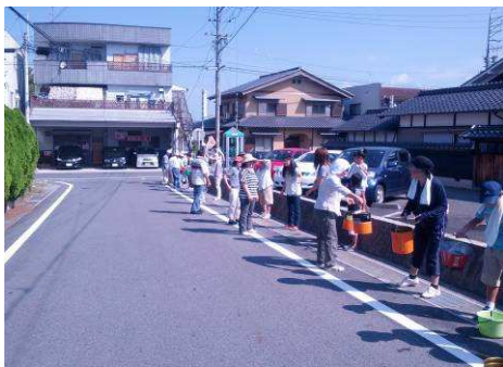
みんなでバケツリレー(4-2区)