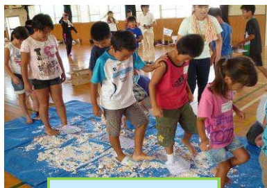
ガラスに見立てた卵の殻の上を歩く避難訓練