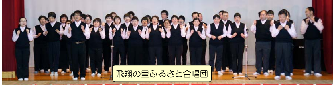
飛翔の里ふるさと合唱団