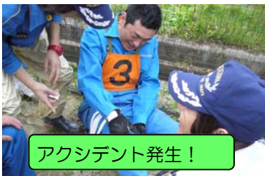
アクシデント発生!