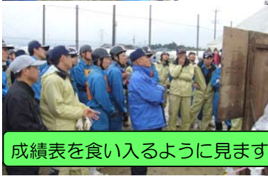
成績表を食い入るように見ます