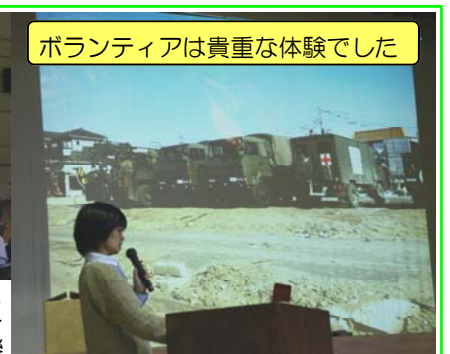
ボランティアは貴重な体験でした