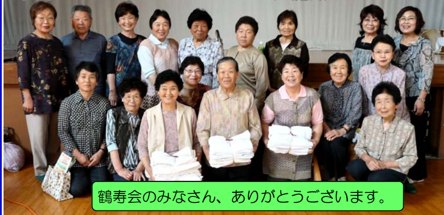
鶴寿会のみなさん、ありがとうございます。