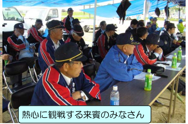
熱心に観戦する来賓のみなさん