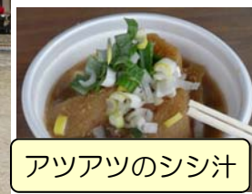
アツアツのシシ汁

「坂本でグランドゴルフを楽しむ会」はがんばる地域サポート事業の補助を受けて設立した会です。お年寄りの健康増進と引きこもり防止のためグランドゴルフを通して交流と仲間作りに励んでいます。グランドでプレーしますのでアップダウンがありません。誰でも楽しめます。ただいま、会員募集中です。あなたもやってみませんか。