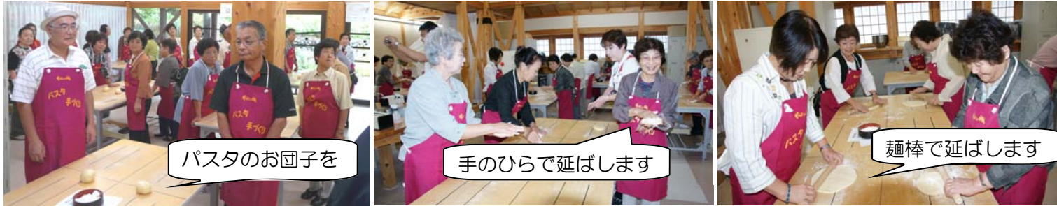
パスタのお団子を