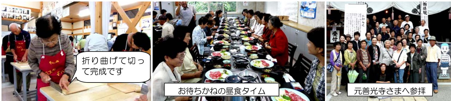
折り曲げて切って完成です