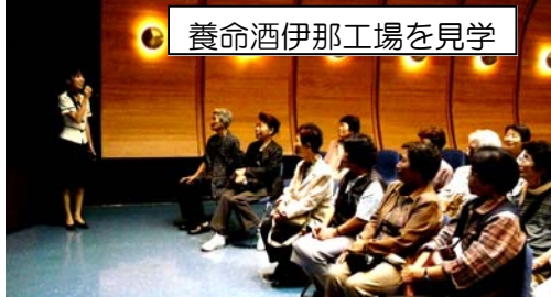
養命酒伊那工場を見学

9月16日に坂本公民館高齢者はなのき大学の社会見学に79名の方が参加されてバス2台で初秋の信濃路を巡ってきました。最初に下條村のそばの城でパスタ打ち体験をしました。なんでそばの城でパスタなの?という疑問はありましたが、みなさんと上手に出来上がりました。私のパスタは茹でるときにくっついてしまい大失敗しました。みなさんは美味しく食べられましたか?おいしいお昼ご飯と養命酒も試飲できたし楽しく旅することができました。雨で南アルプスが見えずちょっと残念でした。