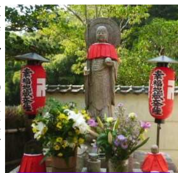
鈴虫寺の幸福地蔵

9月13日に、はなのき大学は社会見学で京都鈴虫寺と嵐山へ行って参りました。当日はとても暑い日となりましたが、鈴虫たちの涼しげな音色が参加者に涼を運んでくれました。写真はどんな願い事でも一つだけ叶えて下さることで有名な幸福地蔵さんです。