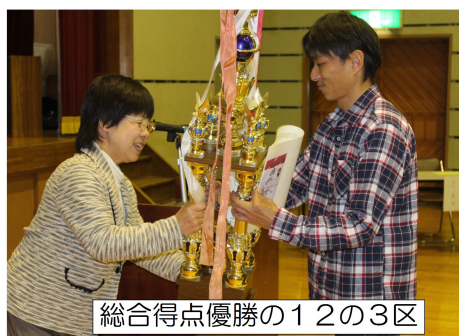
総合得点優勝の12の3区

体育協会では、みなさんがスポーツに関心を持っていただくため、各大会に総合得点制度を実施しています。平成28年度の総合優勝は12の3区でした。総会では、平成29年度の事業計画及び予算等について提案され原案通り可決されました。