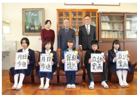
中学生の部入選者（敬称略）