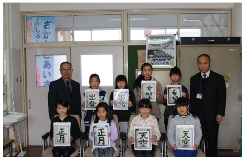
小学生の部入選者（敬称略）