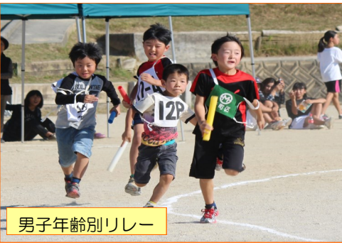
男子年齢別リレー

各地区の体育委員さんをはじめ、運動会開催に向けて準備に携わってくださいます。多くの皆さま、本当に協力ありがとうございました。地域の皆様にご支援をいただき、素晴らしい運動会となりました。来年もまた盛大な運動会を開催できますよう地域の皆さまのご協力をお願い致します。