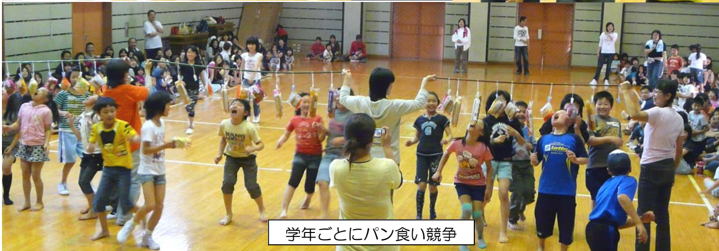
学年ごとにパン食い競争