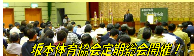
坂本体育協会定期総会開催!

坂本の人口 12,830人(男:6,338人 女:6,492人) 世帯数4,394 【平成22年 4月末現在】 12,816人(男:6,332人 女:6,484人) 世帯数4,378 【平成22年 3月末現在】