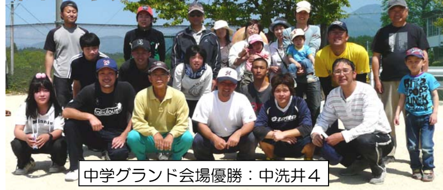
中学グランド会場優勝:中洗井4