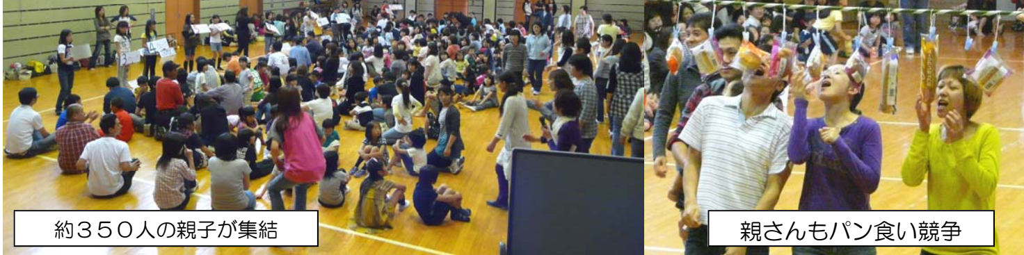
約350人の親子が集結