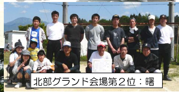
北部グランド会場第2位:曙

5月16日(日)に坂本体育協会主催の第41回区民ソフトボール大会が開催されました。昨年は大雨で中止となりましたが、今回は快晴の下で、みなさん、気合が入っていました。18チームが9チームづつに分かれ、中学校グランドと北部グランドでトーナメント形式で戦いました。優勝は結果です。くじ運もあるでしょう。実力の差もあるでしょう。しかし、力を出し切れれば、そしてチームワークが深まれば、負けて悔いなしです。平凡な当たりがセンターのファインプレーになり、真正面の何でもないサードゴロが長打になる。これで流れが変わるのがソフトボールの面白いところでしょうか!?あと、応援団の力も大きいですね。ご家族だけでなく、区長さん達も応援に駆けつけたチームもありました。選手のみなさん、お疲れ様でした。さぞかし、ビールが美味しかったと思います。このソフトボールの楽しさを忘れずに、来年も必ず参加してくださいね。今年参加できなかったチームのみなさんも待ってますよ。