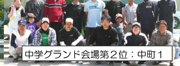
中学グランド会場第2位:中町1