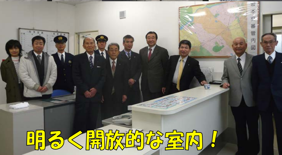
明るく開放的な室内!