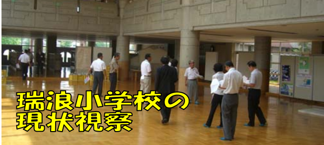
瑞浪小学校の現状視察