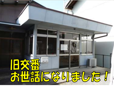
旧交番お世話になりました!

開所式は生憎の天候でしたが、関係者のみなさんにお集まりいただき、無事終了しました。その後交番内を見学し立派な施設に改めて感激しました。この交番の開所式の日を「坂本地域の安全安心の日」として、事件、事故のない住みよい坂本を築いていきたいものです。