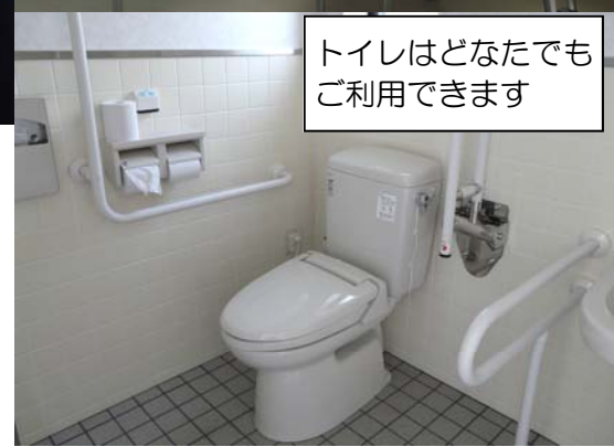
トイレはどなたでもご利用できます