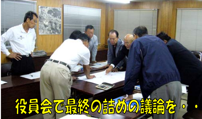
役員会で最終の詰めの議論を...