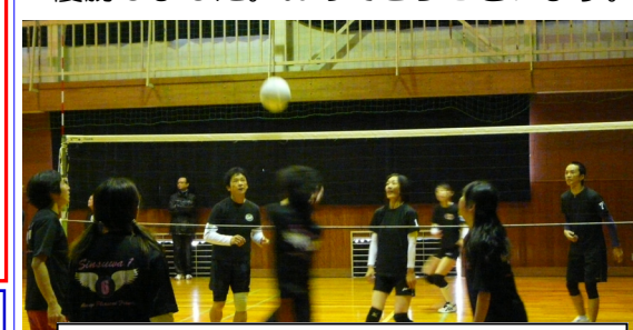
ソフトバレーはチームプレーが大事です