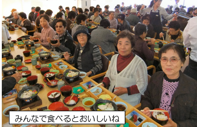
みんなで食べるとおいしいね