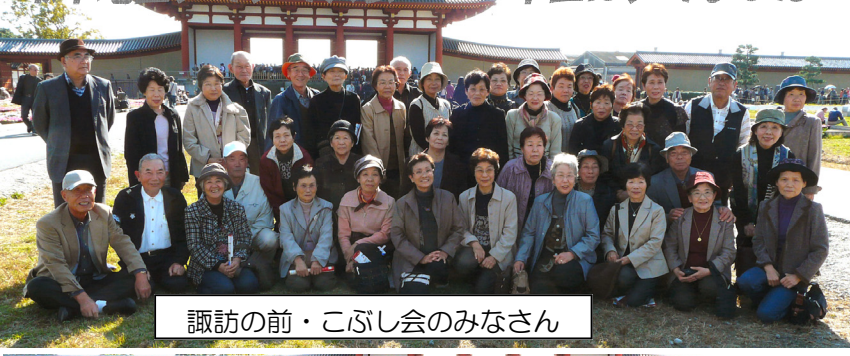
諏訪の前・こぶし会のみなさん