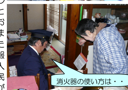
消火器の使い方は・・・