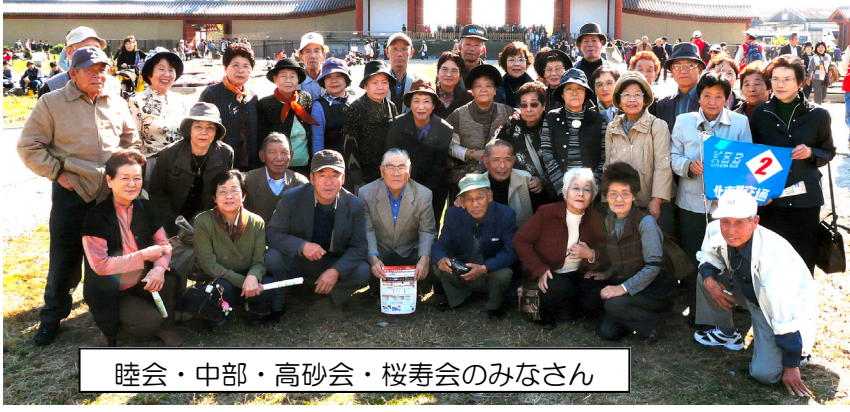
睦会・中部・高砂会・桜寿会のみなさん

ナント（710）きれいな平城京！ナクヨ（794）ウグイス平安京！1300年前の平城京の人々は何を思って暮らしていたんでしょうか？それにしても広い！