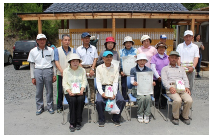
団体の部上位3チーム

6月11日(土)マレットゴルフ場二軒屋コースにて「第9回坂本マレットゴルフ大会」が開催されました。当日は天気にも恵まれ最高のマレットゴルフ日和となりました。