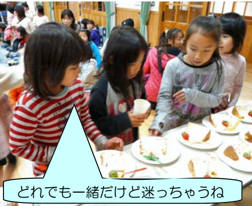
どれでも一緒だけど迷っちゃうね