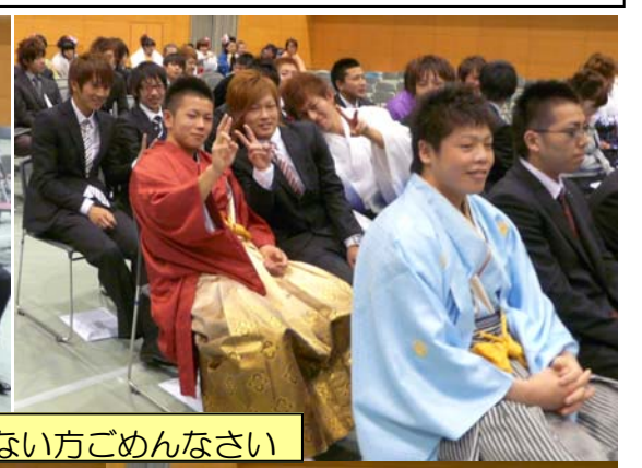
写ってない方ごめんなさい