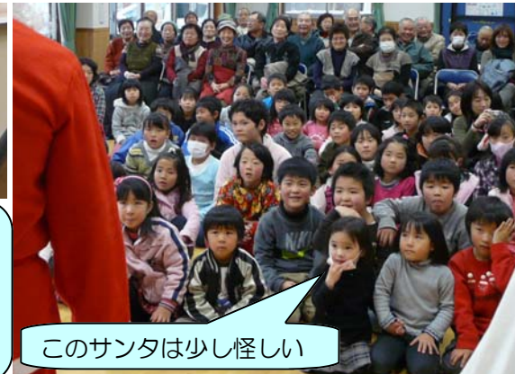
このサンタは少し怪しい