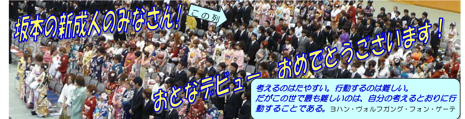
坂本の新成人のみなさん！