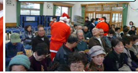
サンタさん堂々の入場です