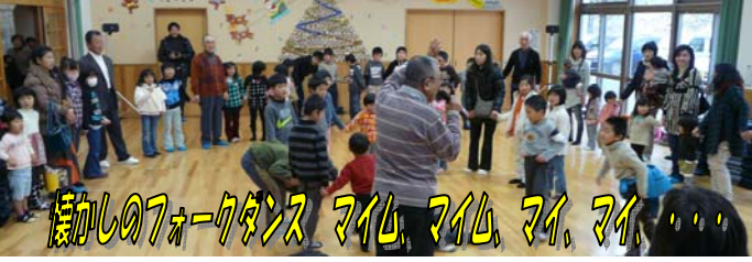
励しの7-7ダンス マイル、マイル、マイ、マイ、...