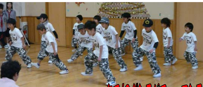
タワのダンスパフォーマンス