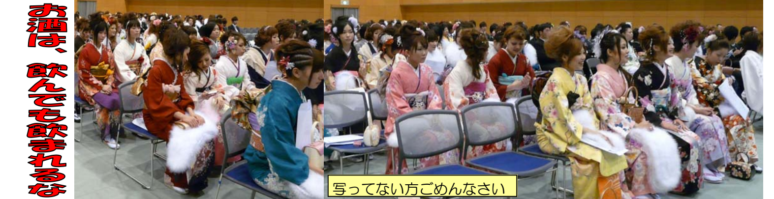
写ってない方ごめんなさい