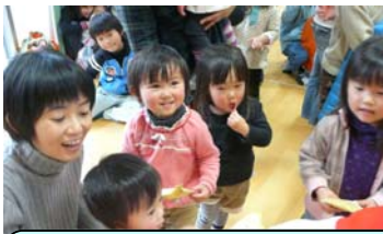
おちびちゃんにも、お嬢さんにも、さあどうぞ