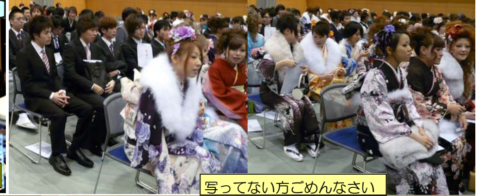
写ってない方ごめんなさい