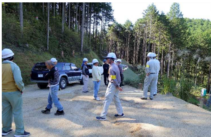
(若山地区の作業道)

若山地区では、リニア送電線鉄塔敷建設工事終了後の作業道を、どのように返却してもらうかなど現地で協議しました。