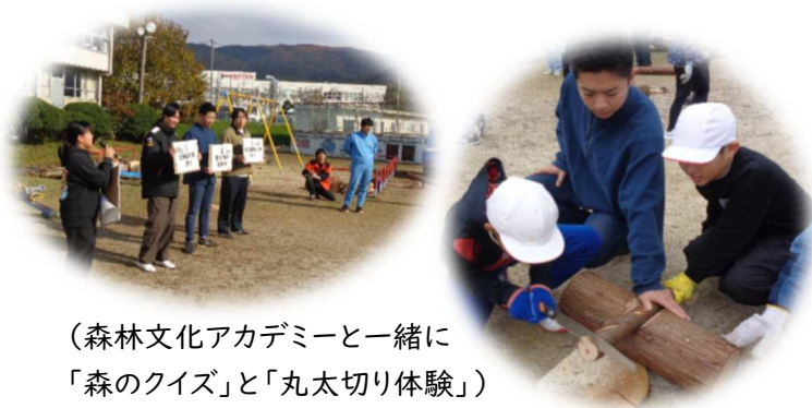
(森林文化アカデミーと一緒に「森のクイズ」と「丸太切り体験」)

意外と身近にあふれている「森の恵み」について楽しみながら学んでもらうことができました。