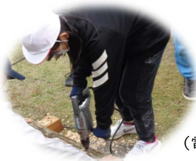
(電動ドリルで穴開け)

今回の体験を通じて、自分たちの生活が自然との深い関わりの上に成り立っていると、わずかも感じてもらえたのであれば嬉しく思います。