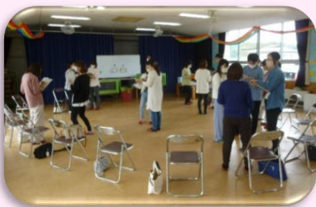
初めまして交流ゲーム

保護者の方からも「息子の友だちのお母さんと初めて話ができてうれしかったです」と感想をいただきました。