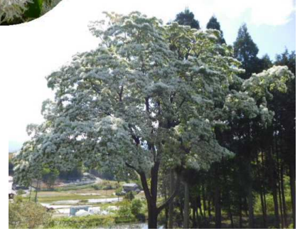
狩宿のヒトツバタゴ