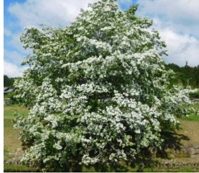
室屋のヒトツバタゴ

苗木には天然記念物に指定された「自生ヒトツバタゴ」が、狩宿川沿いにある県指定の木（室屋のヒトツバタゴ）と県道苗木恵那線沿いにある市指定の木（狩宿のヒトツバタゴ）とそれぞれあります。